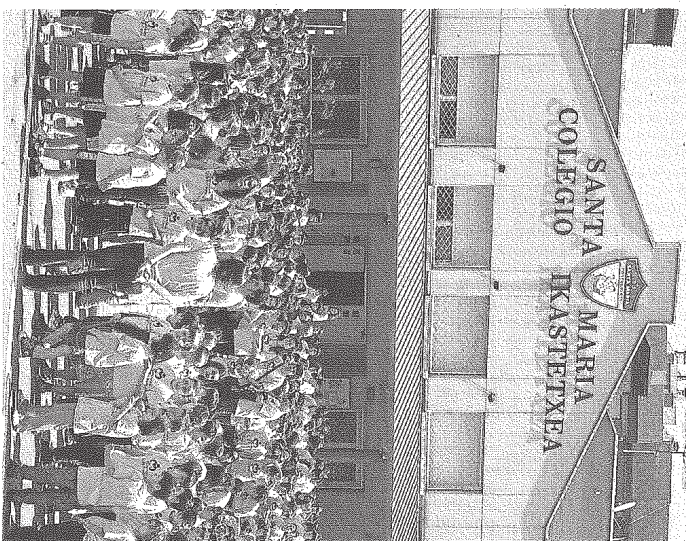
En el logotipo participaron 1.405 alumnos desde los tres años.

La comunidad educativa se completa con el club de tiempo libre Gazte Alai y la ONG S.A.L.